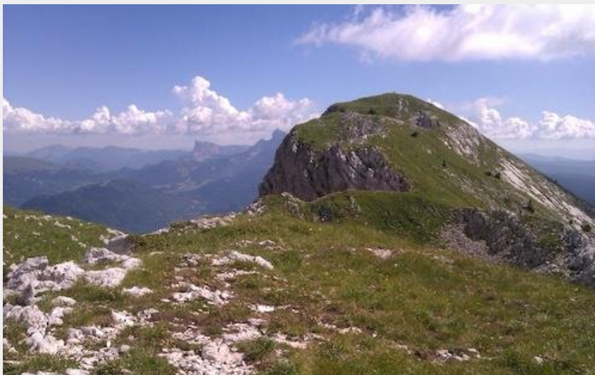
Tête des Chaudières (V.Giry)