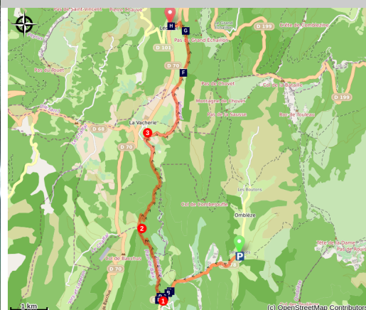
Cascade de la Pissoire (Omblèze) (S&M_Booth)

Découvrez les Gorges d'Omblèze et le Canyon des Gueulards au travers cette randonnée pittoresque.