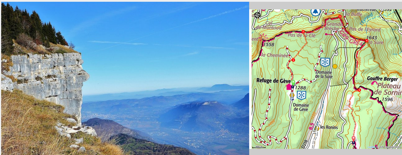
Vue sur la vallée grenobloise depuis La Sure