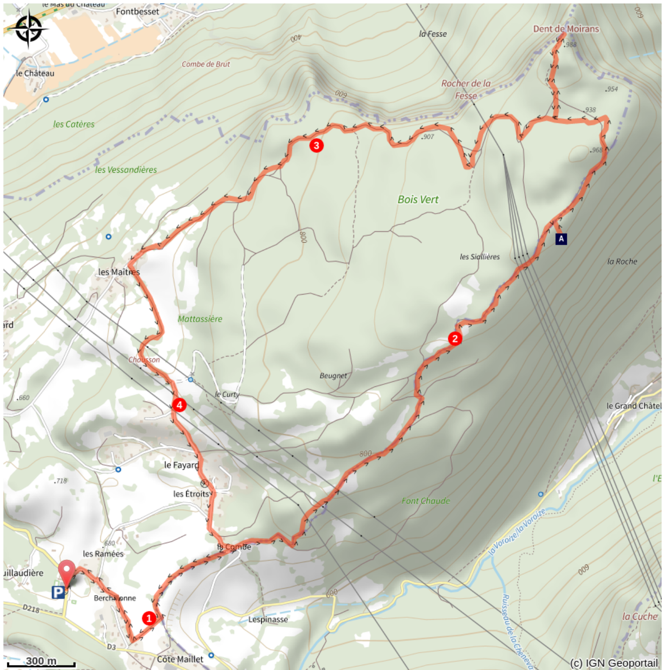
Bois Vert (A)