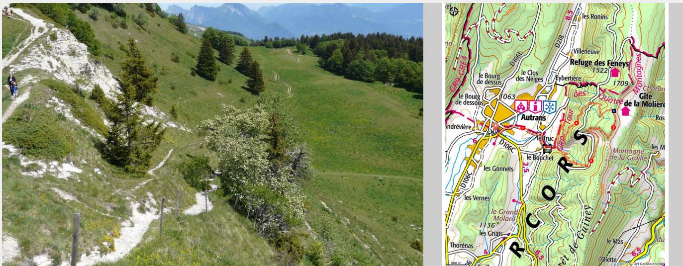
Le Pas de Bellecombe et l'alpage de la Molière (Cavat.)

Partez à la découverte des paysages authentiques et sauvages autour du cirque de Bellecombe.