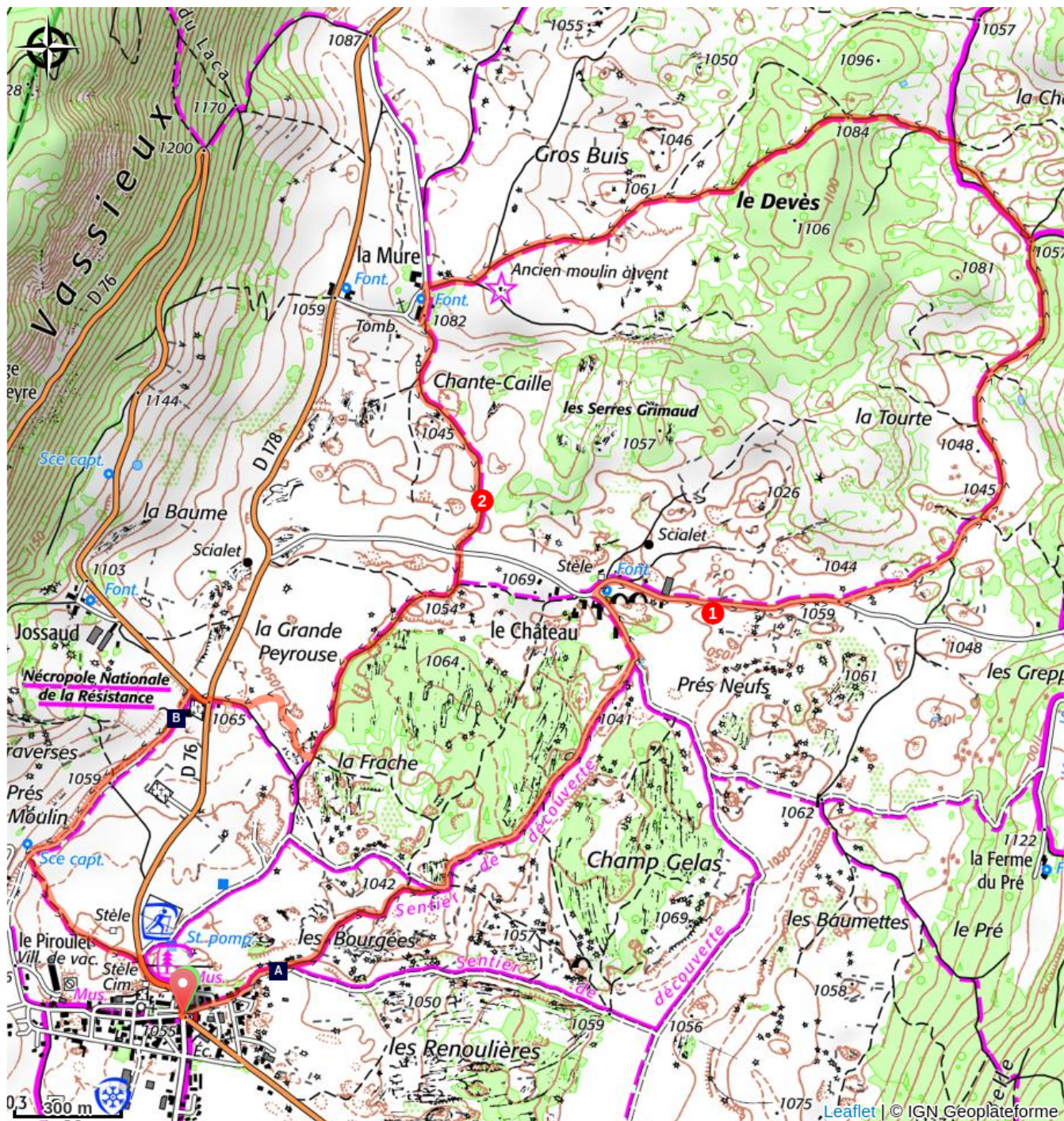
Les moulins à vent (A)