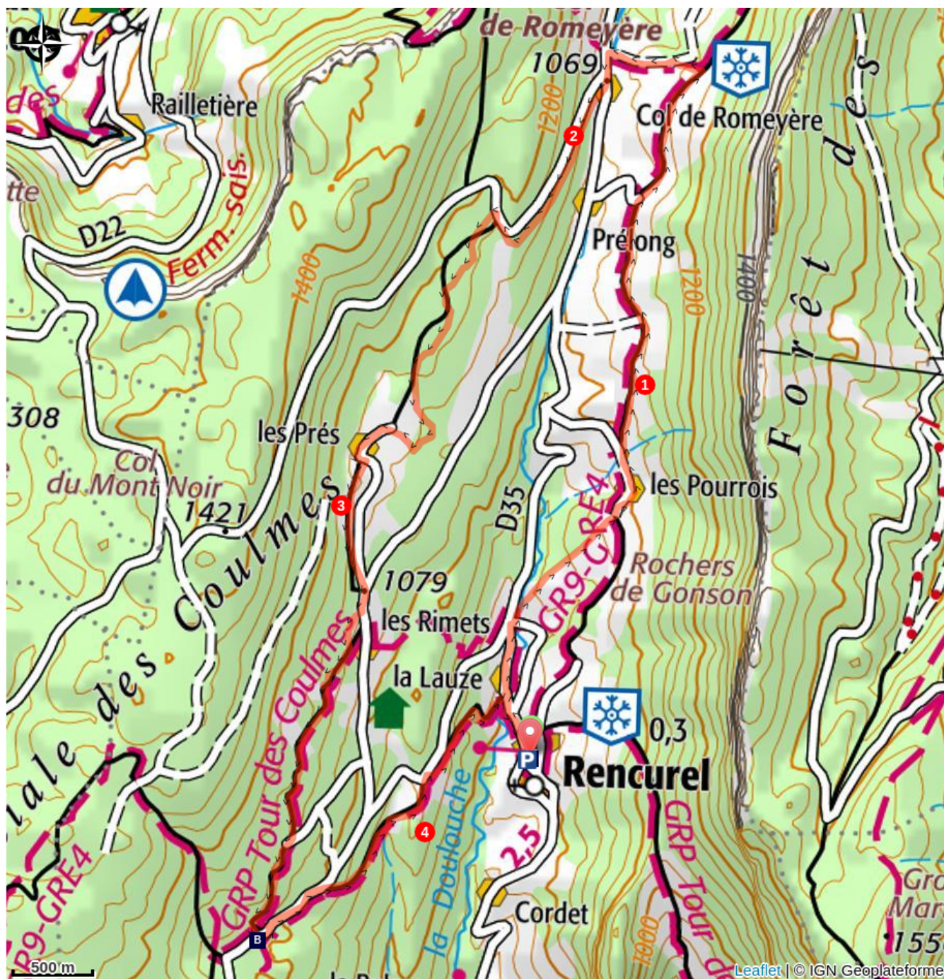
Village de Rencurel (A)