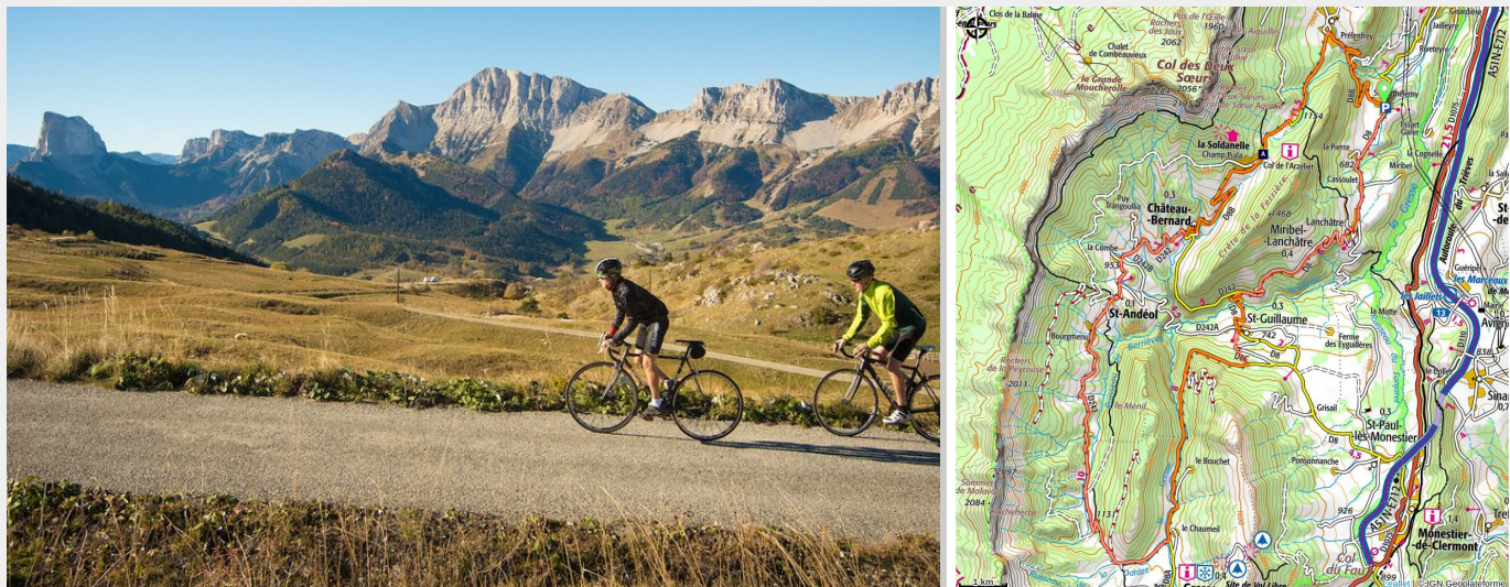
Sur la route des Balcons Est (David Boudin)

Longez la muraille du Balcon Est du Vercors, en roulant au pied des vertigineuses falaises calcaires formant une barrière naturelle spectaculaire surnommée « Les Dolomites Françaises ».