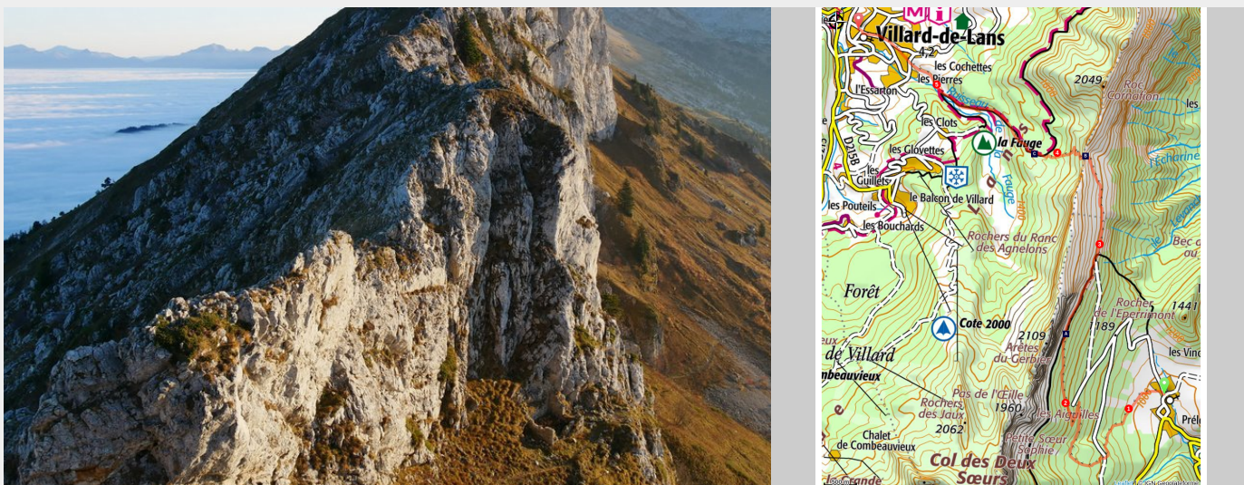
Vue sur le Ranc des Agnelons depuis le Col Vert (Vincent Martin)

Un itinéraire original en traversée pour revisiter ce magnifique belvédère et rejoindre le plateau du Vercors depuis le pied des falaises. Rando Bus en partenariat avec l' Association Alpes-Là , à retrouver dans le Mobiguide - 50 randonnées en Isère sans voiture .