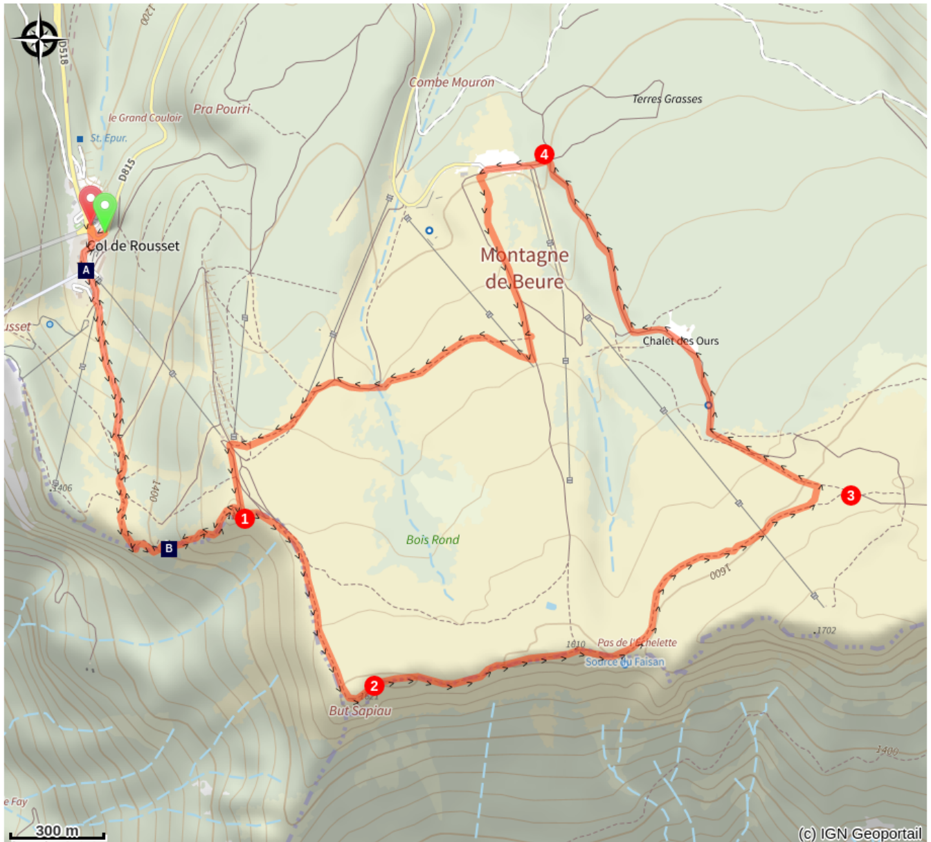
Le temps des pionniers (A)