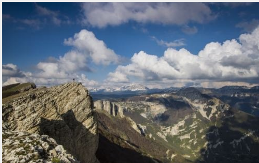
Vue sur la Réserve Naturelle (S&M Booth)