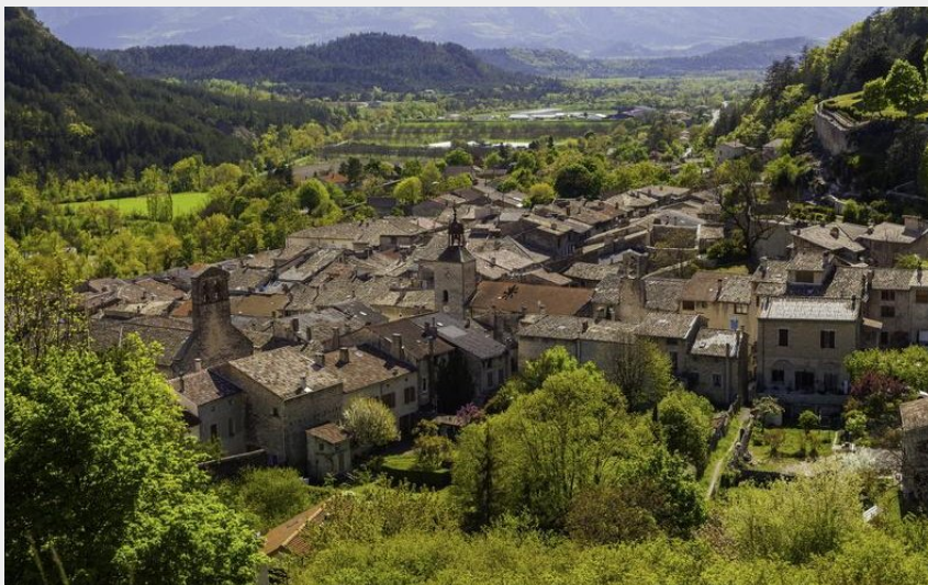
Vue sur Châtillon-en-Diois (P_Conche)