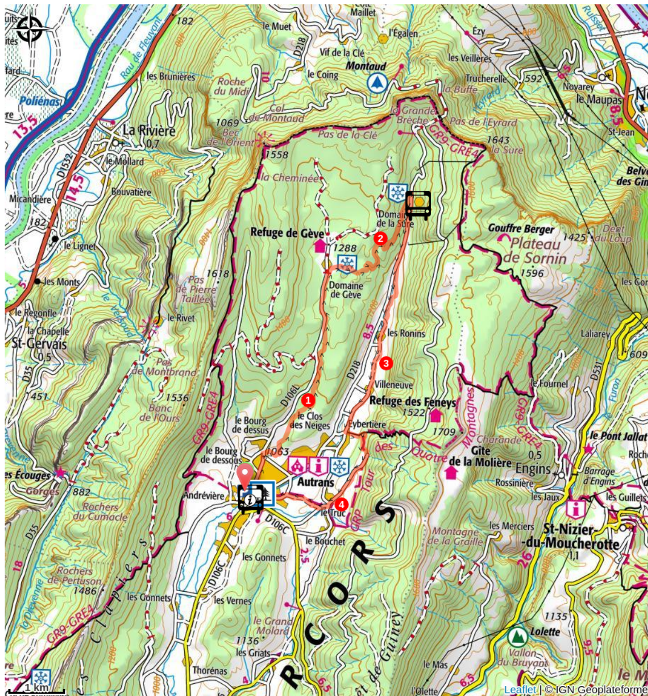
Plateau de Gève (A)