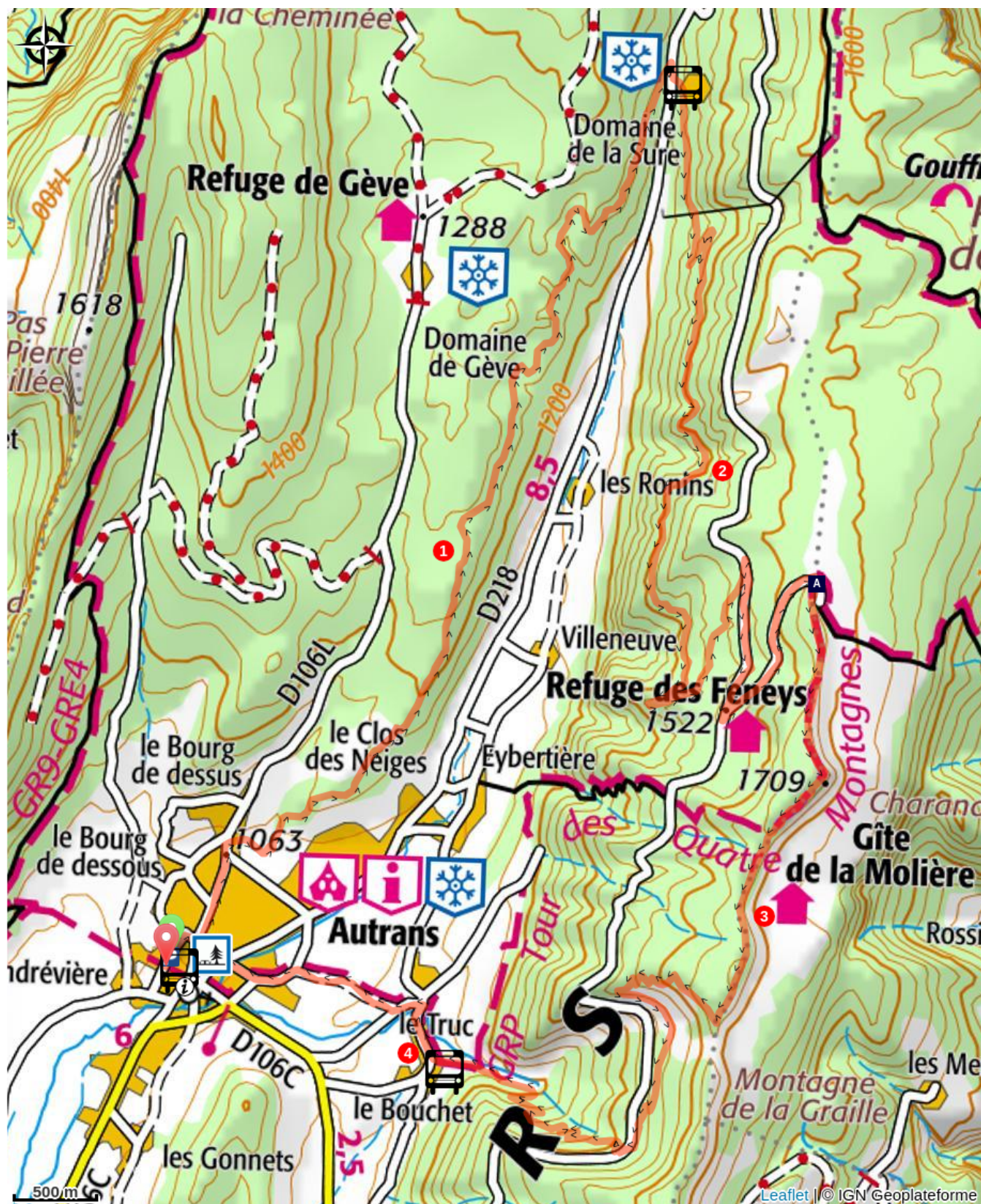
Belvédère de la Molière (A)