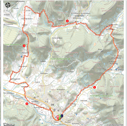
Village de Die (Emilie3838)

Un circuit qui vous transporte dans le cœur historique de Die tout en vous faisant découvrir les richesses environnantes