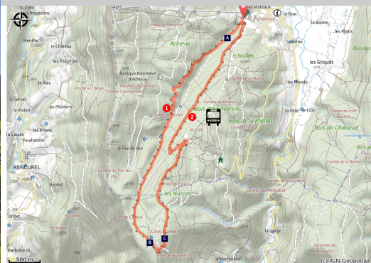
Village de Méaudre (P_Conche)

Partez rejoindre le Gros Martel et son imposante croix en fer, point haut du massif environnant avec une vue exceptionnelle sur les alentours qui permet de découvrir de magnifiques panoramas.