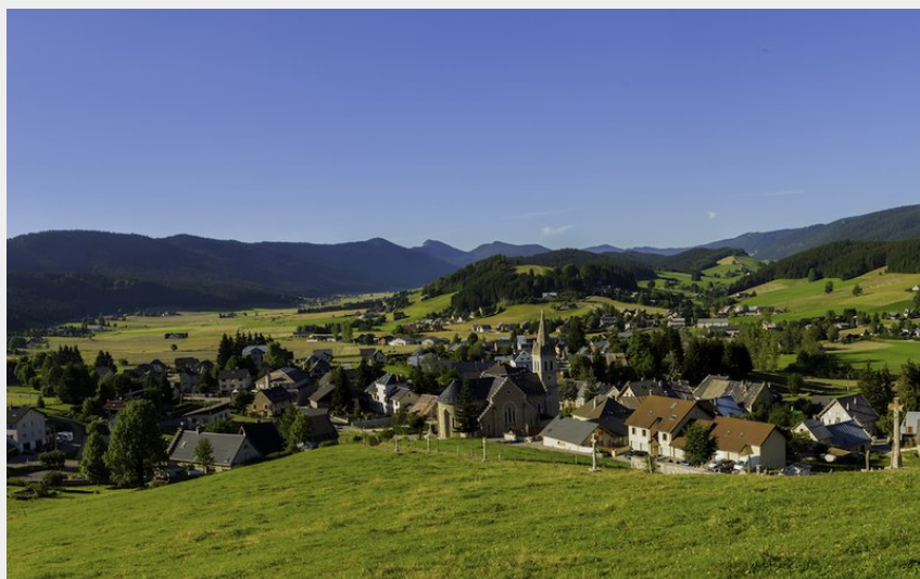
Village de Méaudre (P_Conche)