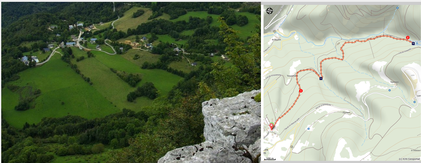
Vue sur le village de Malleval-en-Vercors

À ne pas manquer, le magnifique cirque de Malleval-en-Vercors et son passé historique relatif à la seconde guerre mondiale ainsi que le monument «Le gisant» à l'entrée du village vous attendent