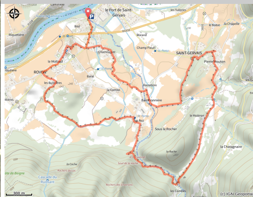
Gorges du Gorgonnet

Les gorges de la Drevenne qui symbolisent la fin du canyon des Ecouges, lieu où la Drevenne se jette dans l'Isère. Vous découvrirez les beaux villages de Saint-Gervais et Rovon.