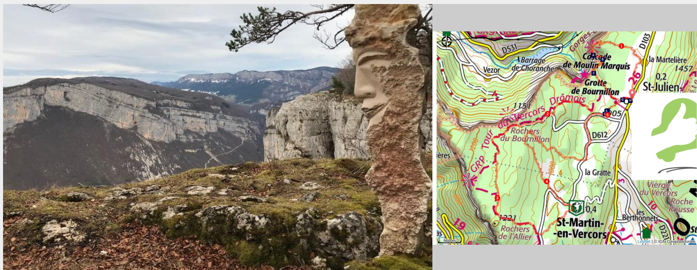
Vue sur les Gorges de la Bourne et le Bienveilleur (Pierre Mayade)

Partez à la découverte des richesses géologiques du Vercors