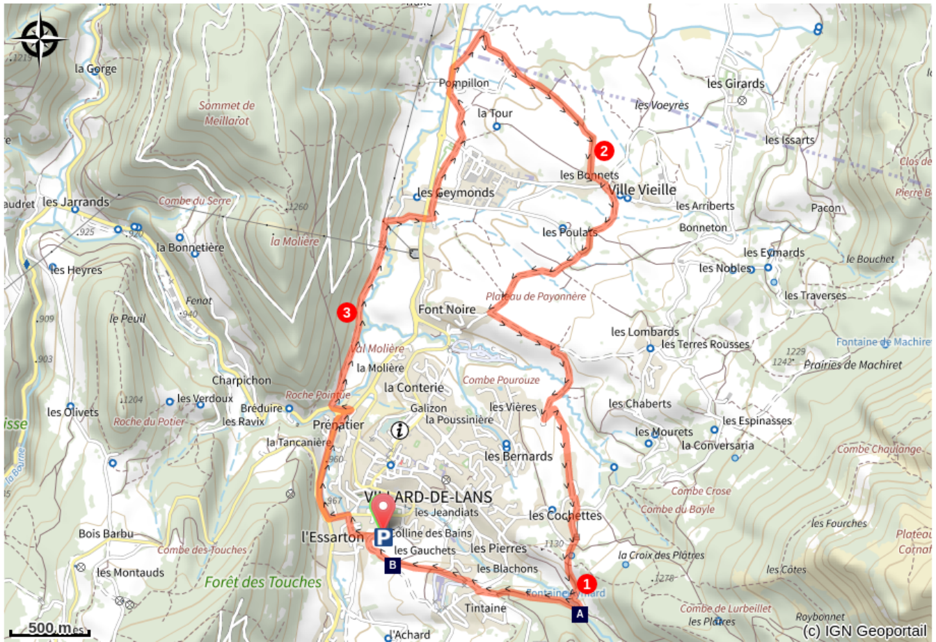
Pont de l'Amour (A)