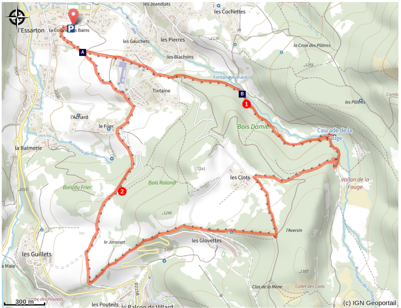
La colline des Bains (A)