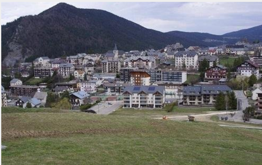
Vue sur Villard-de-Lans