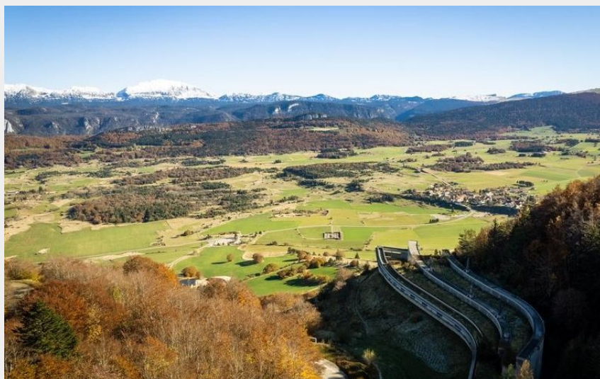
Vassieux - Le Col de la Chaux (@FOCUS-OUTDOOR)