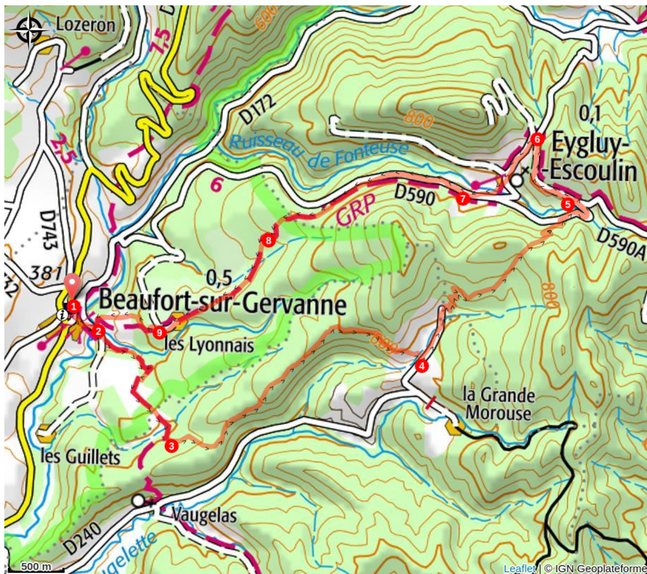
Maison de la Résistance Mathias Mathieu (A)