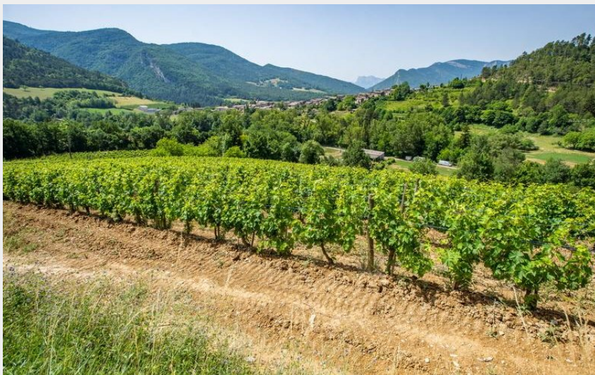
Vignoble du Dois (Nacho Grez)